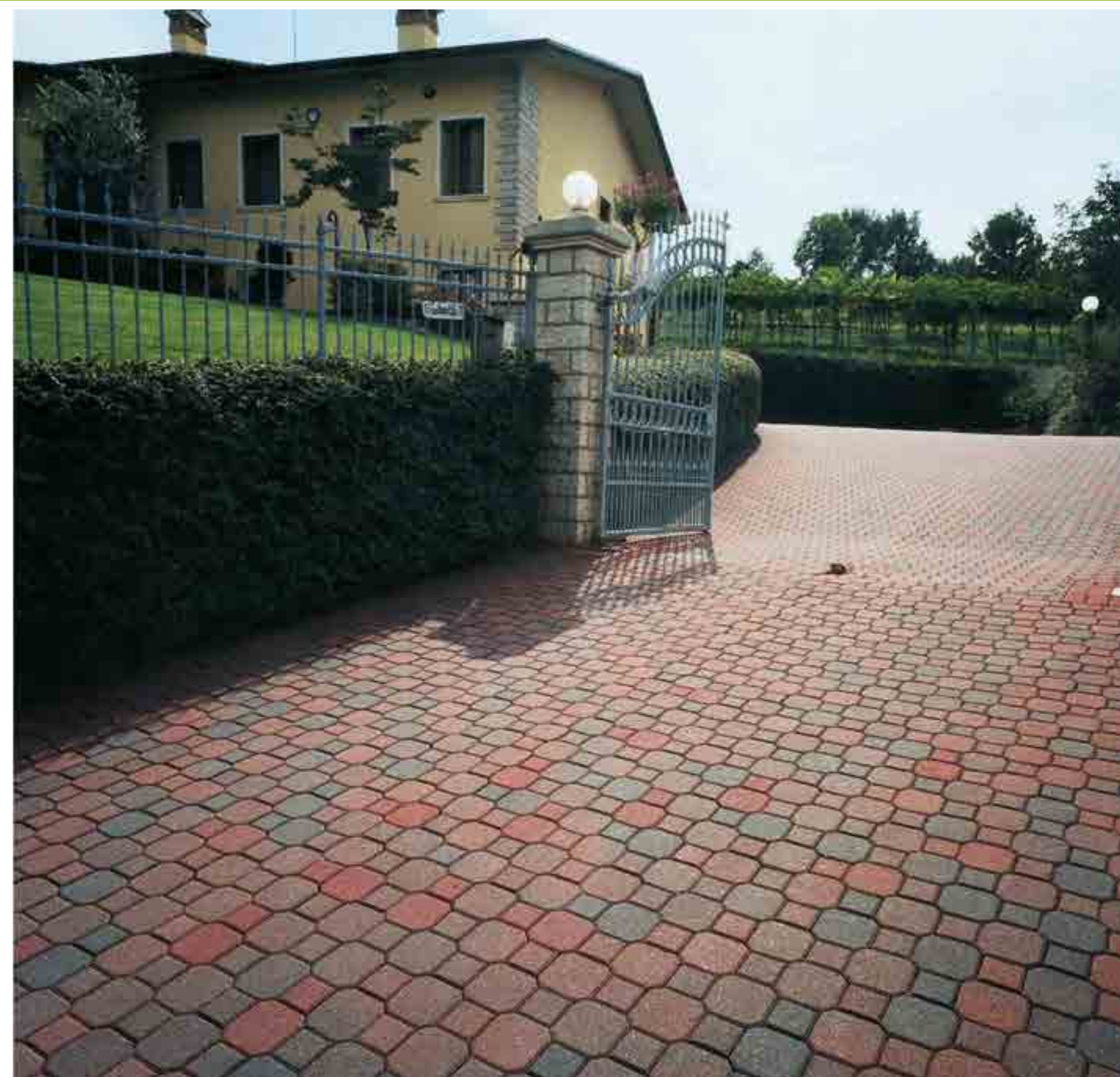
Pavimentazione in "Unidecor" spessore 6 cm. colorazione Mix Base Rossa.