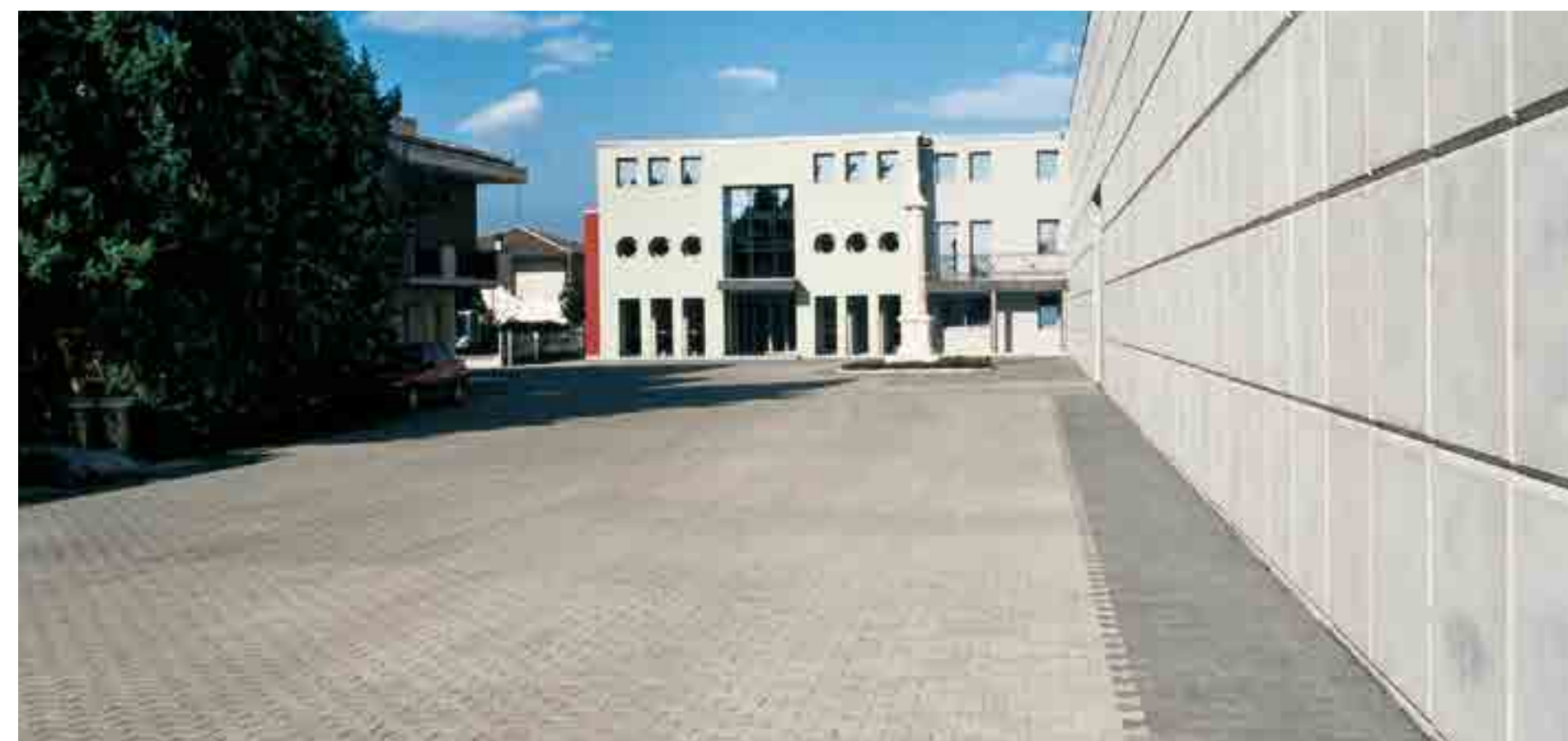
Pavimentazione di "Doppia T" spessore 8 cm. Colorazione grigio con fascia laterale colorazione Nero Antracite.